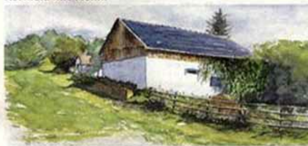
Bauernhaus in Siebenbürgen.