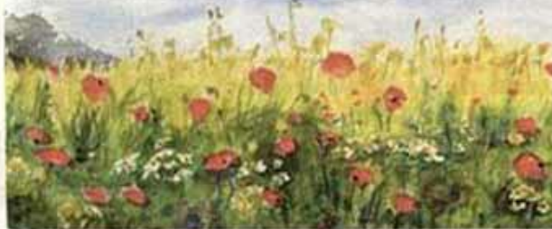
Kornfeld mit Mohn.

Weitere Bilder finden Sie im Internet unter www.mehr-wissen-ld.de mit der Nummer 2480.